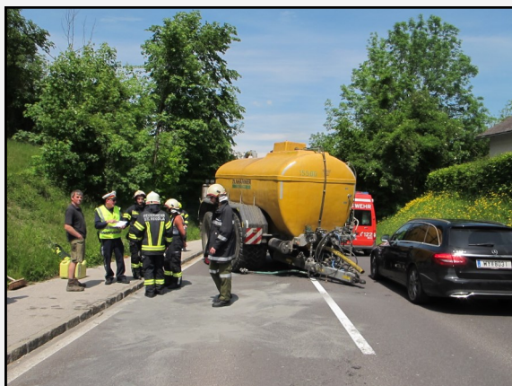
Verkehrsunfall B 140