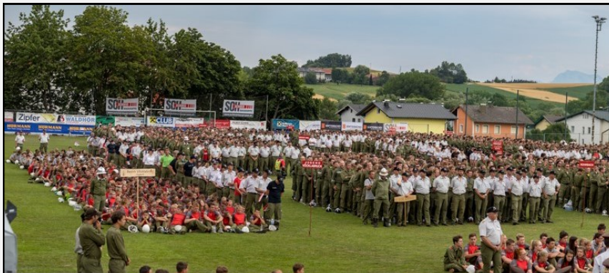
Siegerehrung beim Landesbewerb in Frankenburg am Hausruck