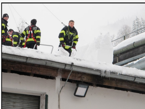
Schneeinsatz in Rosenau