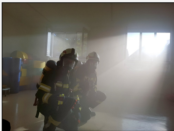
Räumungsübung in der Volksschule und im Kindergarten