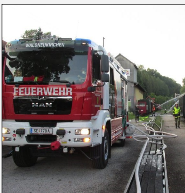
Einsatzübung mit der FF Waldneukirchen bei der Steyrtalbahn