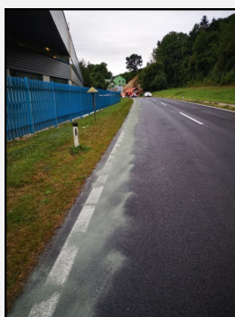
Kilometerlange Ölspur auf der B 140